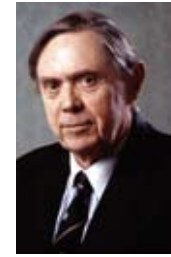
Donald J. Johnston

gouvernements, la population et les groupes d'intérêt.