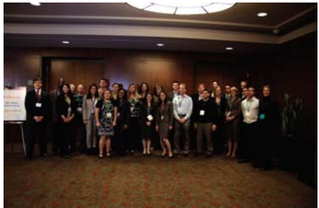
Le groupe 2011 des membres contacts jeunes (Young lawyer liaisons) de Meritas