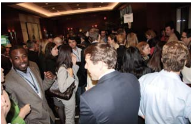
Sortie de groupe le mercredi 11 mai 2011

E n ce printemps pluvieux, même le soleil était au rendez-vous pour le XXI ème Congrès mondial du réseau international Meritas. Près de 400 avocats provenant de 56 pays se sont réunis au Westin de Montréal du 11 au 13 mai 2011 à l'invitation de BCF, membre québécois de ce prestigieux réseau.