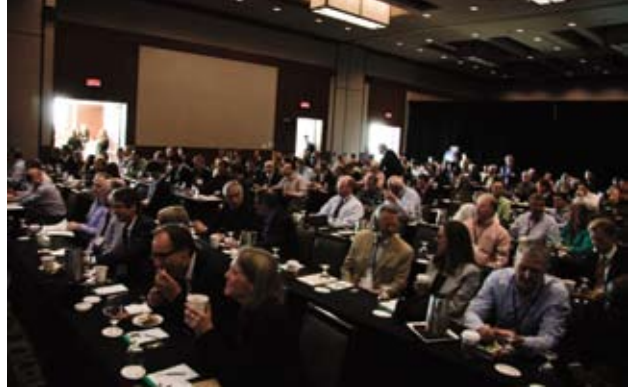
Congressistes au travail

Comme rappel du Congrès, cependant, rien ne surpassera cette inoubliable finale, une jeune contorsionniste qui défie la gravité et les lois les plus élémentaires de la physiologie humaine, lançant aux quatre vents durant sa performance la fondue au chocolat dans laquelle elle trouve miraculeusement son équilibre pour sa prestation. BCF cherchait à laisser sa marque dans l'imaginaire de ses invités, c'est vraiment une trace indélébile d'un événement à saveur