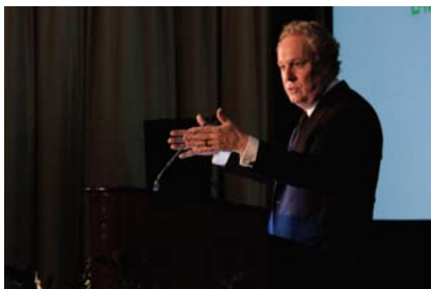
Le premier ministre Jean Charest s'adresse aux congressistes

Les congressistes ont réagi avec enthousiasme à l'allocution-surprise du Premier ministre du Québec, Jean Charest. Son discours, prononcé devant une salle comble tôt un vendredi matin, a ravi ces avocates et avocats venus du monde entier. Le libre-échange avec l'Europe, la participation des états fédérés aux négociations commerciales internationales, la mobilité de la main-d'œuvre et bien sûr le Plan Nord, ont été quelques-uns des sujets abordés lors d'une stimulante présentation.