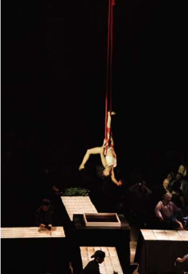
Jeune contorsionniste des Sept Doigts de la Main

la durée du Congrès par la généreuse contribution des cabinets canadiens du réseau Meritas.