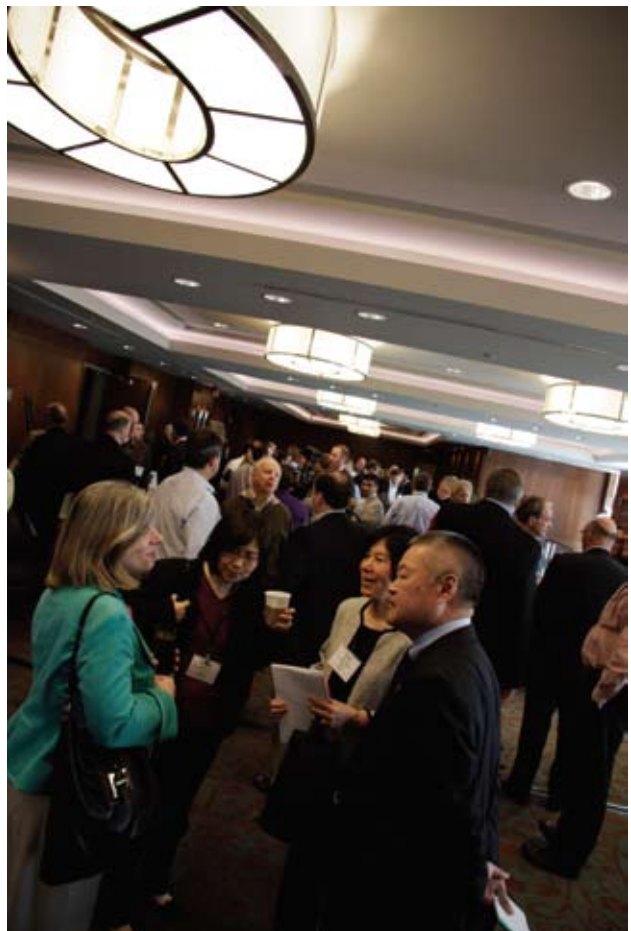
Congressistes en pause matinale