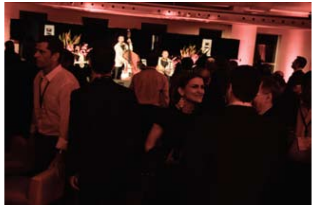
le "Canada Chill Zone"