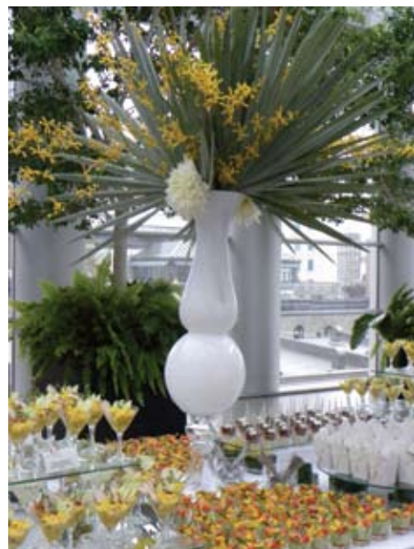
Un magnifique buffet signé Dansereau