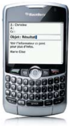
Téléphone intelligent 3G BlackBerry MO Curve MC 8330