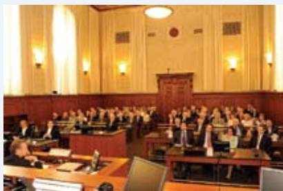
L'assistance à la Salle Louis-Hyppolyte Lafontaine

La cérémonie s'est déroulée dans la grande salle de cour Hyppolite Lafontaine de l'Édifice Ernest-Cormier où siège désormais la Cour d'appel du Québec.