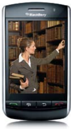
Téléphone intelligent 3G BlackBerry MO Storm MC 9530

Visitez un magasin Bell • 1 866 BELL-BIZ • bell.ca/productivite