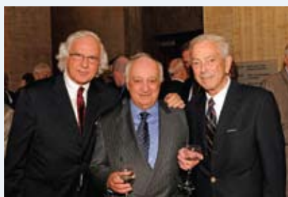
L'honorable Morris Fish de la Cour suprême du Canada le juge Paul-Arthur Gendreau de la Cour d'appel L'honorable Melvin Rothman, ancien juge à la Cour d'appel